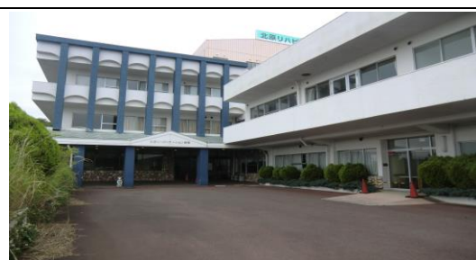
北原リハビリテーション病院