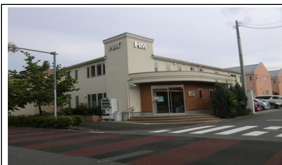
みなみ野心臓リハビリテーション