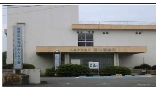
地域福祉推進拠点石川