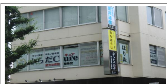
清智会記念病院(わたぼうし)